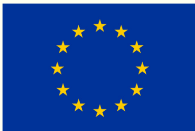
EU Delegation to Norway